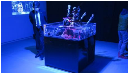
水深300mから上がった ゴミと深海生物の展示水槽