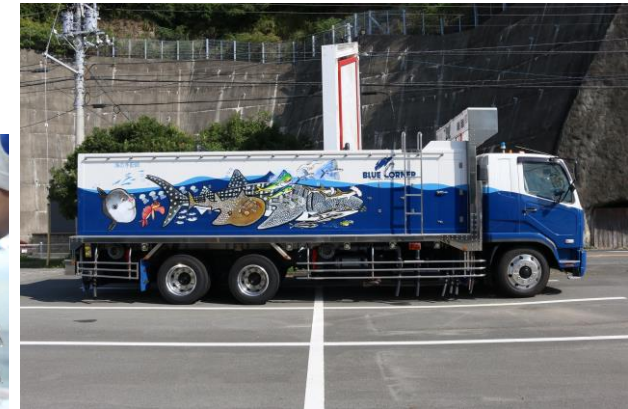
幸せのおさかなトラックがかけつけます

お問い合わせ：“海の手配師”有限会社ブルーコーナー TEL:055-939-1221 ✉ info@bluecornerjapan.com