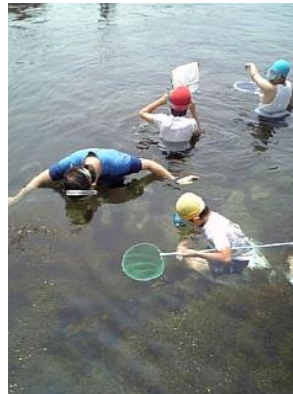
実際に海に出かけよう