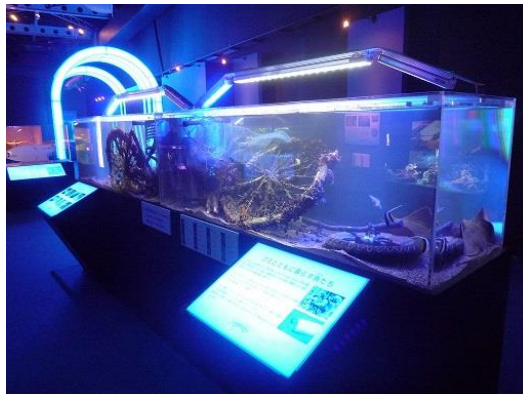
海に捨てられていた自転車やゴミと 東京湾に暮らす魚の展示水槽