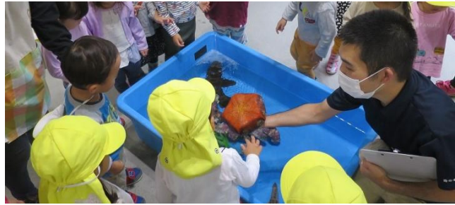
サメやヒトデを触ってみる