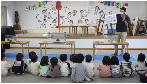
楽しいおさかなクイズだよ