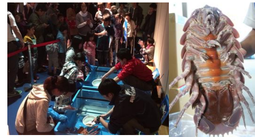
深海生物に触ってみよう