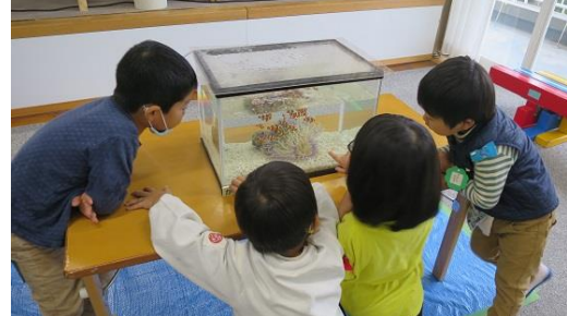
水槽の生きた魚を見て解説も聞けるよ